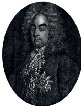
Петр Андреевич Толстой