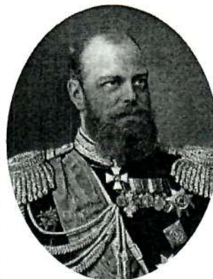
Император Александр III