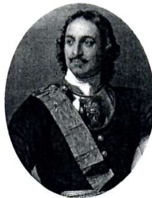
Император Петр I

Сообщениями «о похищении казны» первоначально занималась тайная канцелярия во главе с графом П.А. Толстым. И работала она на совесть. Но были и такие дворяне и чиновники, которые к проблеме мздоимства относились гораздо терпимее. По рассказам современников, однажды в Сенате Петр пригрозил издать указ, по которому всякий, кто украдет у казны сумму, на которую можно купить веревку, будет повешен. Генерал-прокурор Ягужинский на это заметил: «Неужели вы хотите остаться императором без служителей и подданных? Мы все ворует — с тем только различием, что один больше и приметнее, чем другой».