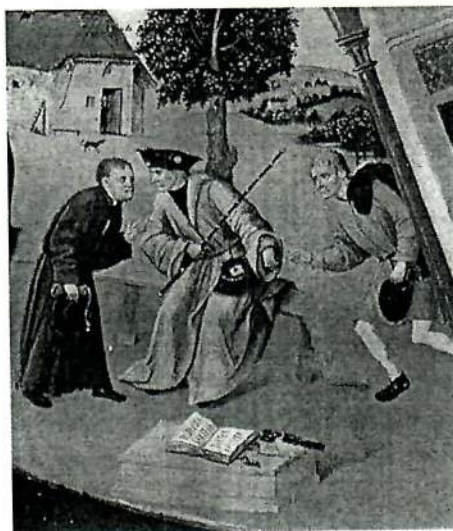
Фрагмент «Алчность» картины Иеронима Босха «Семь смертных грехов»

Рассматривая участников коррупции на примере взяточничества, стоит отметить, что в коррупционном процессе всегда участвуют две стороны. Одна сторона — это взяткополучатель (подкупаемый). Вторая сторона — это взяткодатель (осуществляющий подкуп). Также в процессе может участвовать и третья сторона — посредник.