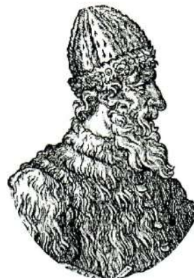
Великий князь Иван III

До XVIII века чиновники на Руси жили благодаря так называемым «кормлениям», то есть, при отсутствии оклада за исправление должности, разрешению на подношения от заинтересованных в их деятельности лиц. Одаривали их не только деньгами, но и «натурой» — мясом, рыбой, пирогами и пр., что было делом обыкновенным.