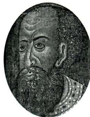
Царь Иван IV Грозный