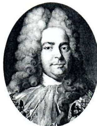
Генерал-прокурор Павел Иванович Ягужинский